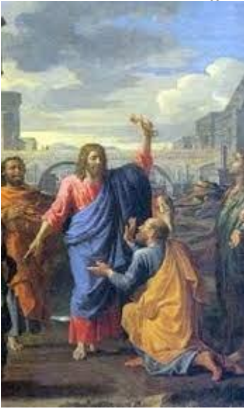
XXI DOMENICA PER ANNUM - A -