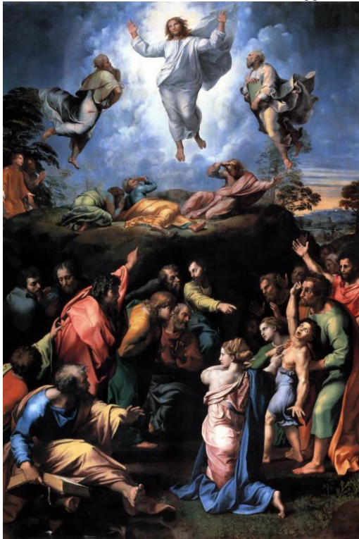
II QUARESIMA - B-